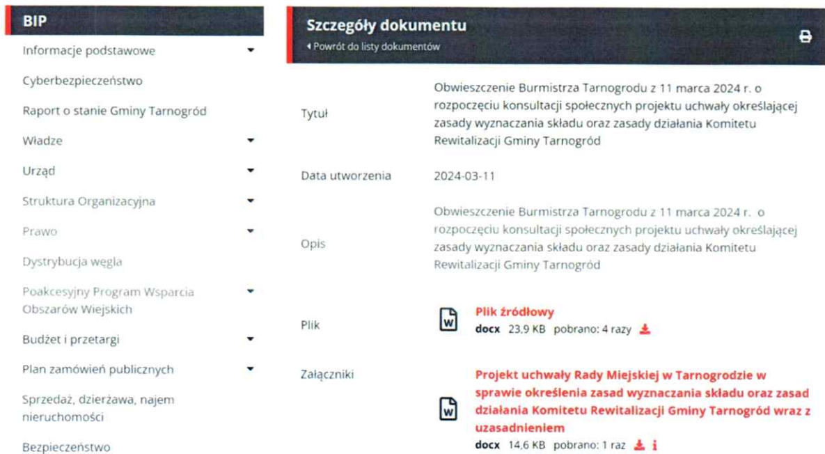
Ryc. 1. Obwieszczenie o konsultacjach na stronie BIP Gminy Tarnogród

W dniu 11 marca 2024 r. ponownie upublicznione zostało obwieszczenie o rozpoczęciu konsultacji społecznych projektu uchwały Rady Miejskiej w Tarnogrodzie, określającej zasady wyznaczania składu oraz zasady działania Komitetu Rewitalizacji Gminy Tarnogród. Obwieszczenie to zostało zamieszczone na oficjalnej stronie Gminy, w Biuletynie Informacji Publicznej oraz na tablicach ogłoszeń na terenie Gminy Tarnogród.